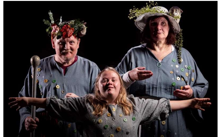
Bildbeschreibung: Flussgott Moenus mit Moena und einem Wasserteufel