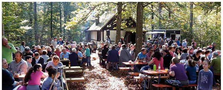
Sternwanderung 2018