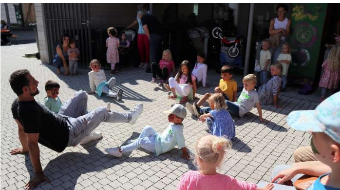
Tanzprogramm mit Dino

Herzlichen Dank deshalb an alle, die zur Realisierung dieser Maßnahmen beigetragen haben.